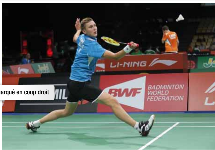
Armé marqué en coup droit