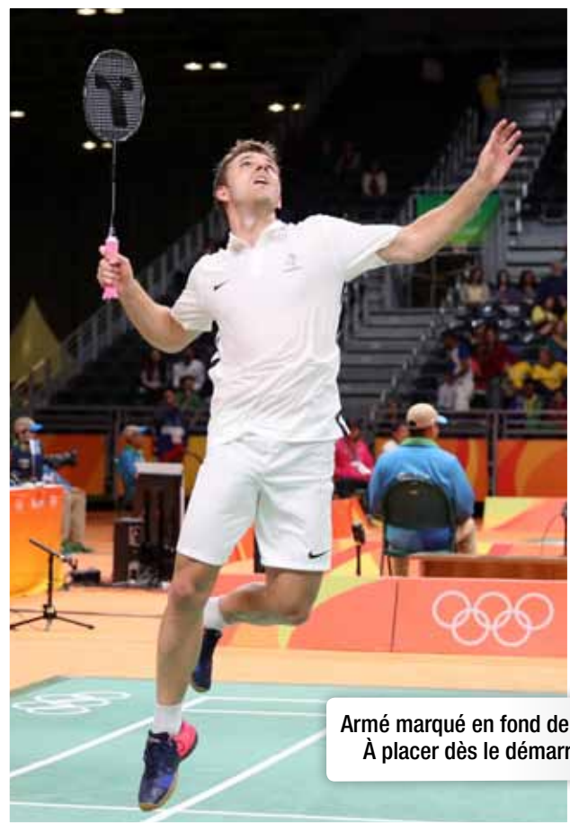
Armé marqué en fond de court. À placer dès le démarrage