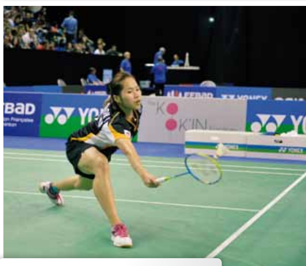
Armé marqué et précoce en coup droit