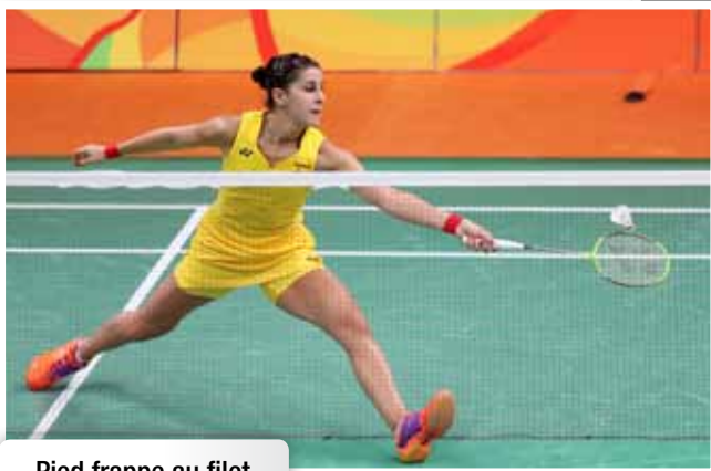
Pied frappe au filet