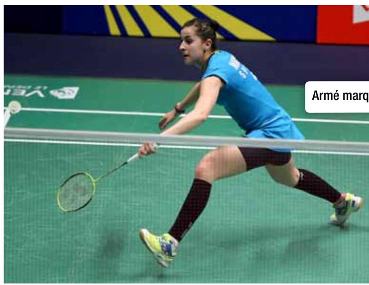
Armé marqué et précoce en revers