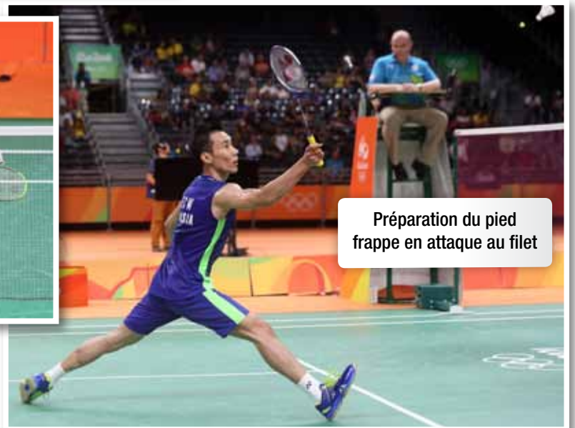
Préparation du pied frappe en attaque au filet