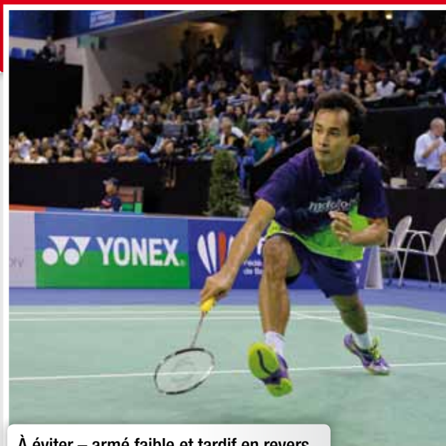
À éviter – armé faible et tardif en revers