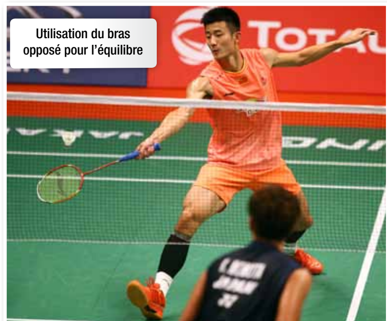
Utilisation du bras opposé pour l'équilibre