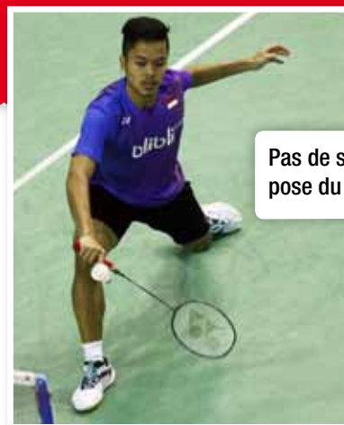
Pas de synchronisation de la pose du pied et de la frappe