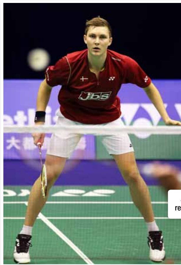
Allègement avant une reprise d'appuis marquée