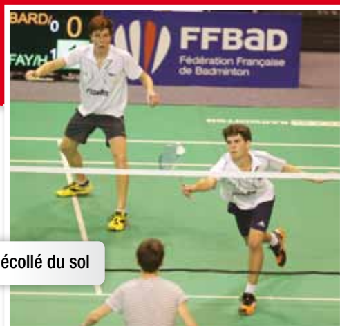
Appui arrière décollé du sol