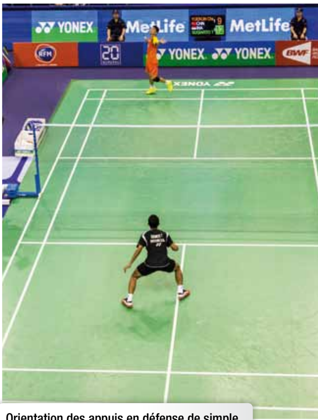
Orientation des appuis en défense de simple