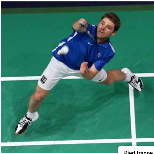
Pied frappe en fond de court