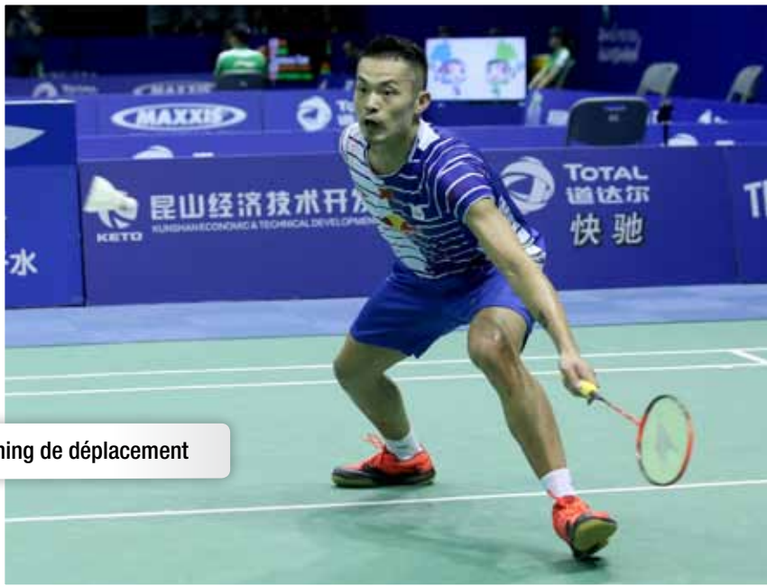
Timing de déplacement