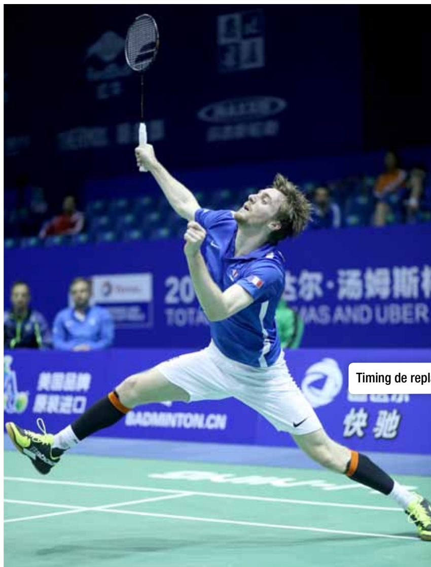
Timing de replacement