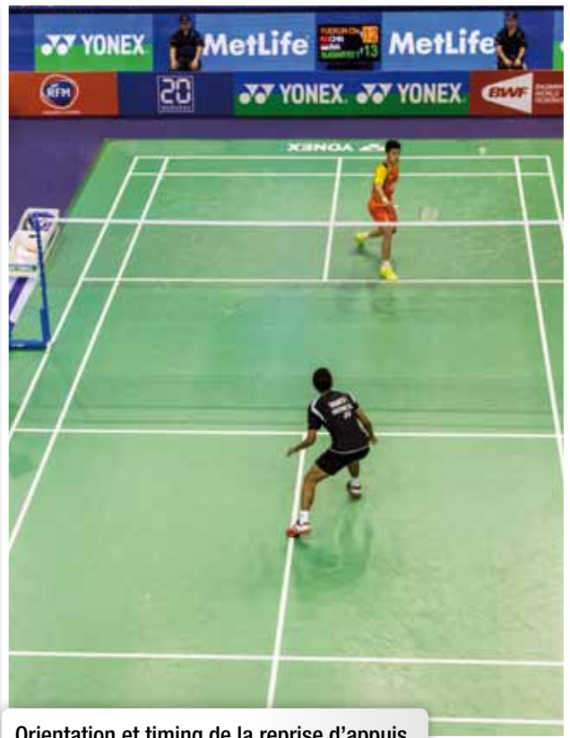
Orientation et timing de la reprise d'appuis