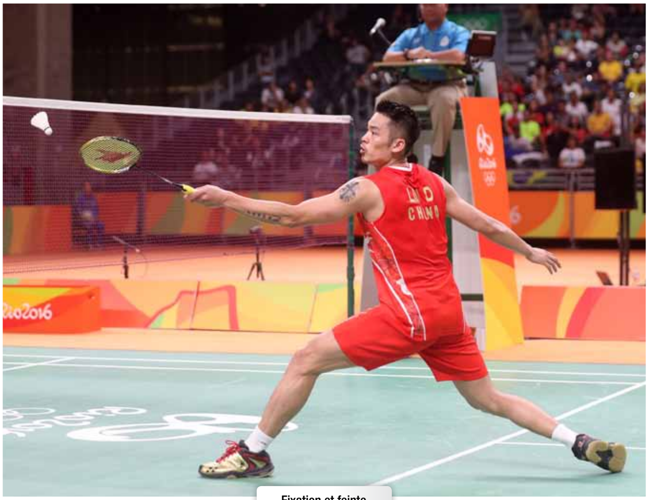
Fixation et feinte