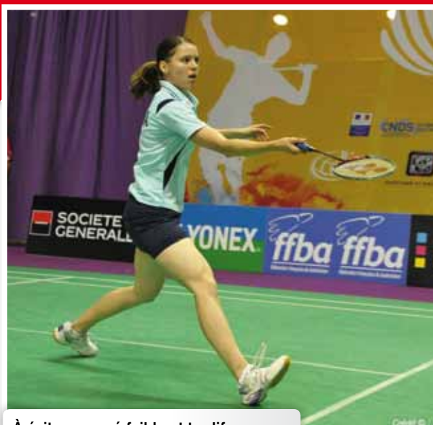
À éviter – armé faible et tardif en coup